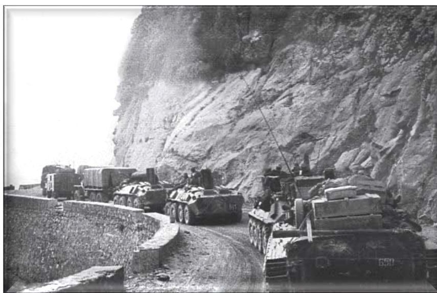
Рис. 11. Сопровождая колонны. Афганская война. Боевые операции

Большое внимание в роте уделялось инструктажу по правилам поведения во время движения колонны. При обстреле на равнине всегда можно уйти влево или вправо. В горах дорога одна, она идёт серпантинном и уклониться в сторону уже не получится. Поэтому в случае подрыва экипаж машины должен был покинуть подбитую технику и эвакуироваться впереди идущую машину. А подбитую сталкивали на обочину, и движение продолжалось.