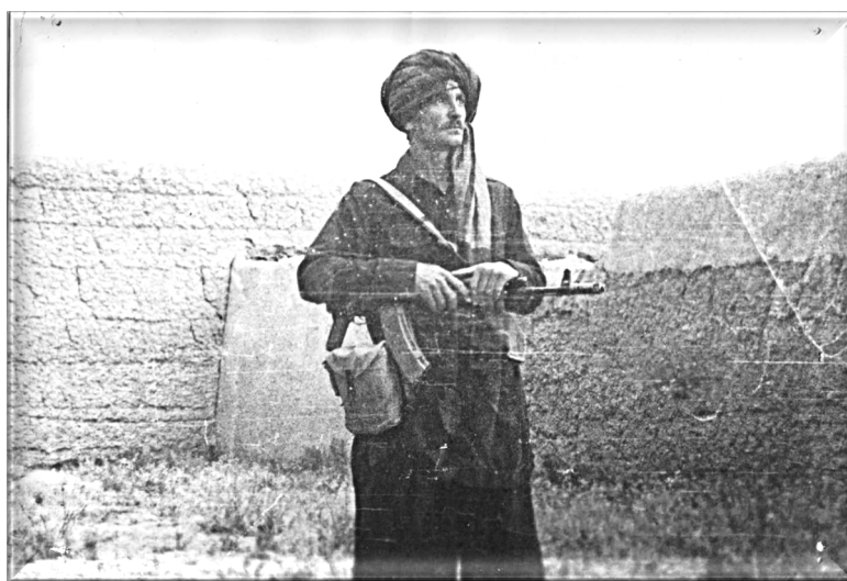
Рис. 10. Маскировка под моджахеда