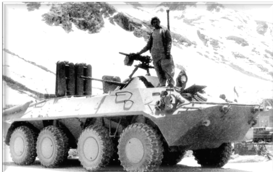
Рис. 4. Боевым «крещением» для БТР–70 стал Афганистан

Со временем, когда они все-таки поняли, что к чему, они стали организовывать самую настоящую охоту за нашей ротой. Сам Ахмад-Шах Масуд (Панджшерский лев) всем своим головорезам дал отмашку – найти и уничтожить! Но ничего у него из этого не получилось!!!