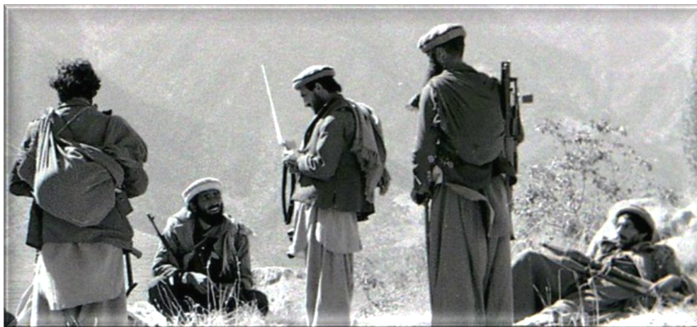
Рис. 6. Афганские моджахеды

доставлялось оружие, боеприпасы, шли караваны с наркотой, шло пополнение живой силы.