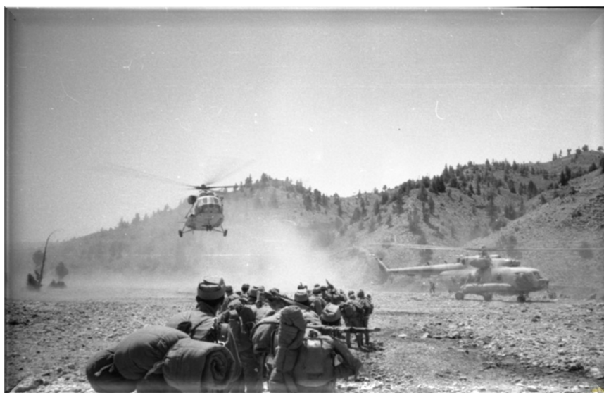
Рис. 3. Рота связи ГВС

Главным плюсом штата роты связи ГВС было то, что мы были полностью автономны. В штате роты было всё, что делало нас мобильными, оперативными, способными выполнять боевые задачи самостоятельно в отрыве от остальных сил. Как сейчас бы сказали – «всё – в одном!». Была своя кухня (ПХД) – вотчина ст. прапорщика В. Г. Зверева, своя автомастерская со всем необходимым оборудованием, где всем управлял ст. прапорщик А. А. Яворский. Свои наливники, водовозки. Постоянно на связи с нами были экипажи двух вертолетов, готовых в любую минуту, в любое время оказать нам помощь – доставка всего необходимого, эвакуация раненых, облет наших КШМ, разбросанных по всему Афганистану (доставить им продовольствие, спирт для обслуживания спецаппаратуры, почту и т. д.).