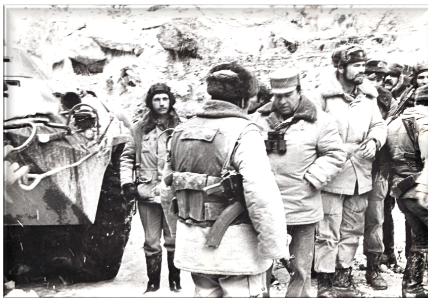
Рис. 7. Инструктаж