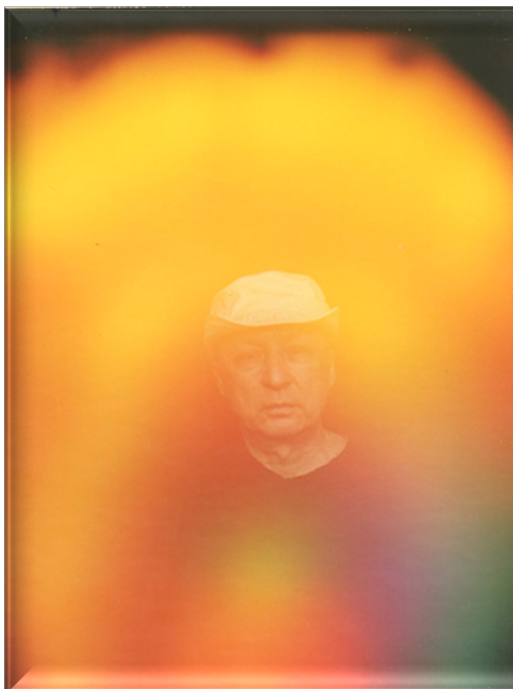
Без Комплекса “СветЛ”