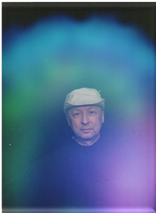
С Комплексом “СветЛ”

У меня на какое-то время пропал дар речи, как, впрочем, и у фотографа. После возврата способности говорить он, сглотнув, спросил: “Как ты это сделал?!” Я шутя сказал “Достигается упражнениями”, расплатился, поблагодарил и откланялся.